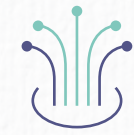
شبكة اتصالات فايبر